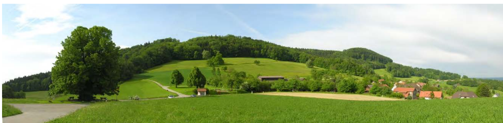
Die Linde, das Wahrzeichen des Dorfes Linn