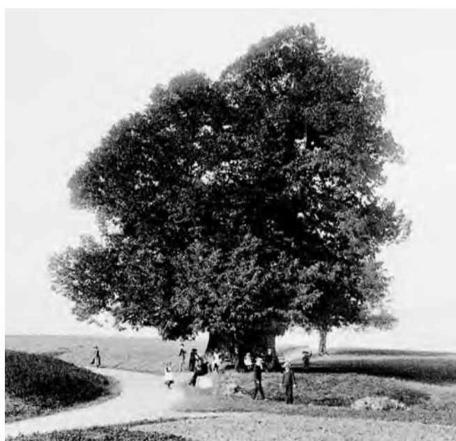
Historische Aufnahme der Linner Linde