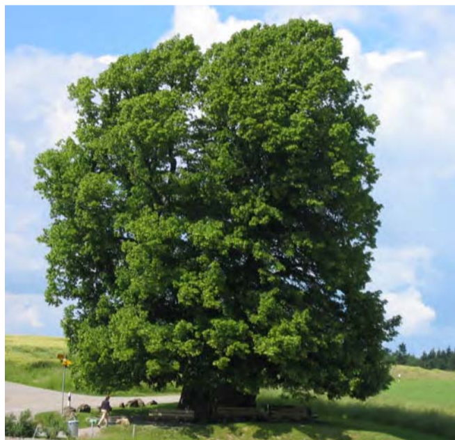
Aktuelle Ansicht der Linner Linde (Foto: M. Erb)

Der Linde wurden auch prophetische Eigenschaften zugeschrieben: «Leit d'linden-ih'r's chöppli uf's Ruedelis hus. Se – n – isch alli welten ûs.» Dies heisst, wenn der Schatten der Linde auf die gegenüberliegende Habsburg falle, sei die Welt zu Ende. Berechnungen haben jedoch gezeigt, dass zweimal im Jahr ihr Schatten in Richtung der Habsburg fällt. Dies ist aber nicht wahrnehmbar, da der Kernschatten gar nicht so weit reicht. (M. Erb)