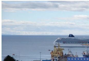
Das Kreuzfahrtschiff Norwegian Sun vor Anker im chilenischen Punta Arenas.

Datum: Freitag, 29. Januar 2010 Zeit: 20:00 Uhr Ort: Feuerwehrlokal Ursprung, Unterbözberg