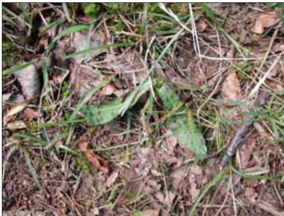
Gefleckte Orchis, Zustand nach der Beweidung