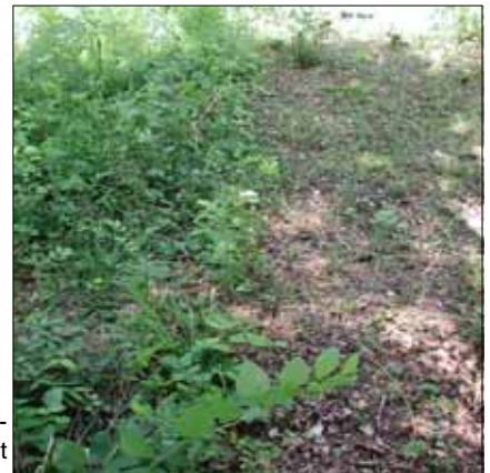
Grenze beweidet - nicht beweidet