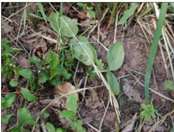
Zweiblatt, Zustand nach der Beweidung

unten: auch in den stark beanspruchten Teilen blühen spezialisierte Arten (Aufrechtes Fingerkraut)