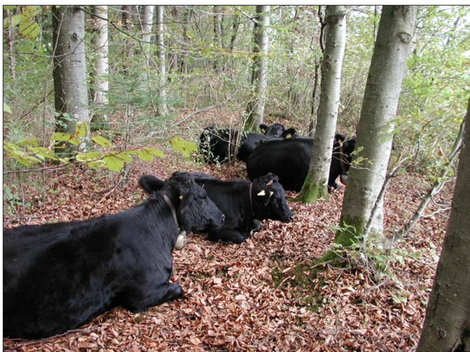
Herde am 11.10.03 (Dexter)