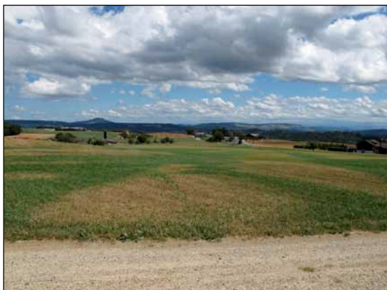
Das längskupierte Gelände setzt sich auch im anschließenden Grabenacher fort, allerdings für die einfachere Bewirtschaftung eingeebnet. (29.7.2015)