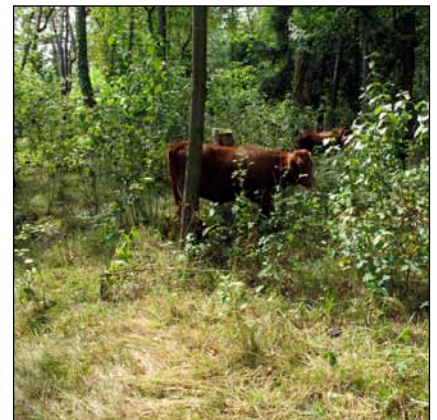
Büsche werden auch verbissen, allerdings nur das Laub. (16.8.2015)