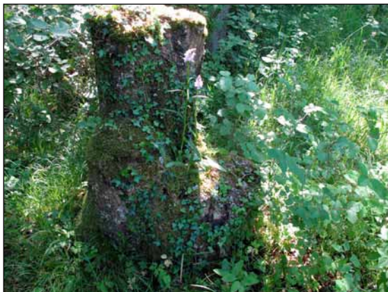
Die Fuchs' Orchis hat sich auf einem Baumstrunk angesiedelt. (12.6.2015)

Verbiss Büsche relativ stark verbissen Trittspuren wenig wenig wenig Kuhfladen einige wenig wenig