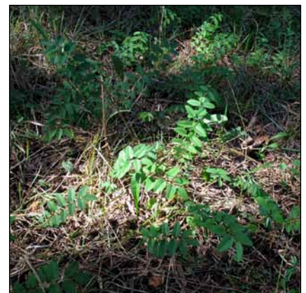
Der Grosse Wiesenknopf ist aus faunistischer besonders wertvoll (31.8.2015)