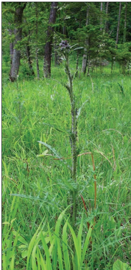
Die Sumpfkatzdistel ist eine beliebte Futterpflanze für Schmetterlinge (29.5.10)