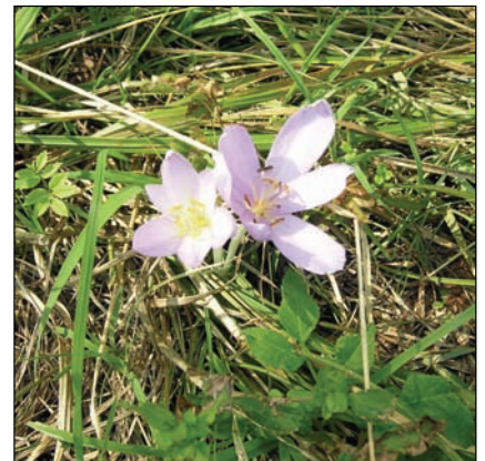
Nach der Weide Ende August blüht die Herbstzeitlose (23.8.09)