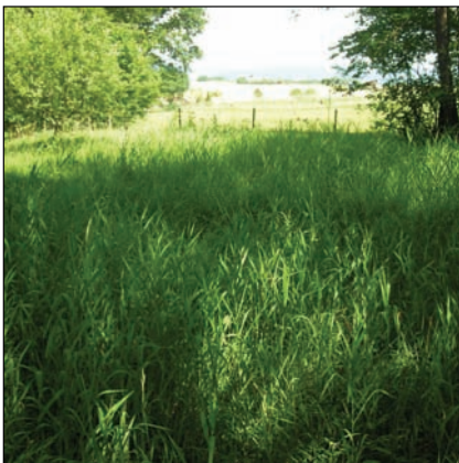
Das Rohrglanzgras gedeiht auch mit Beweidung hervorragend (5.7.09)