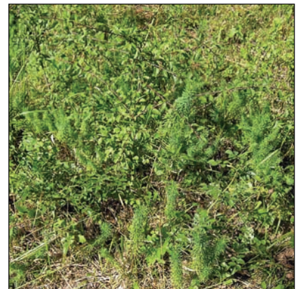
Die Zypressenwolfsmilch wird nicht gern verbissen (23.8.09)