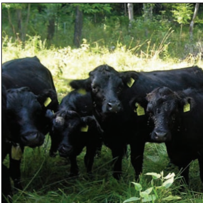
Die Herde am 7.8.09